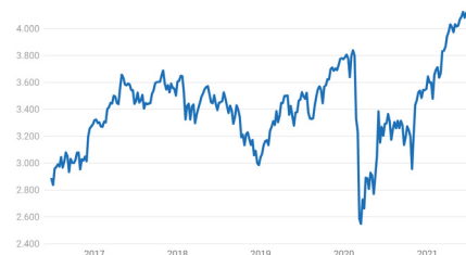
Euro Stoxx 50